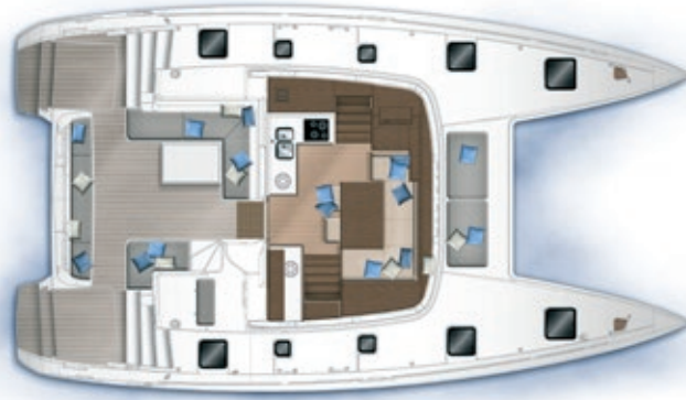
Carré et cockpit / Saloon and cockpit