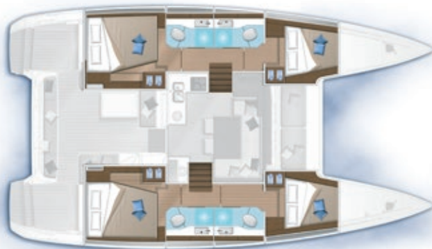
4 cabines, 4 salles d'eau / 4 cabins, 4 bathrooms