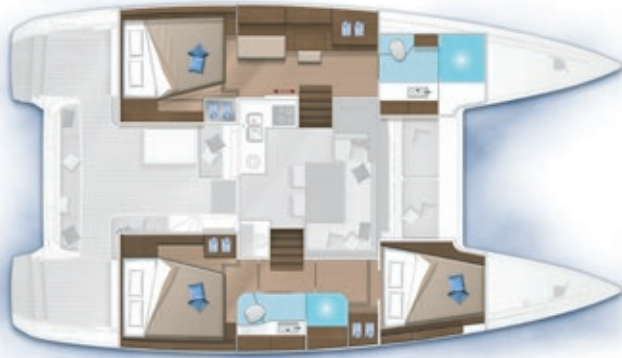
3 cabines, 2 salles d'eau / 3 cabins, 2 bathrooms