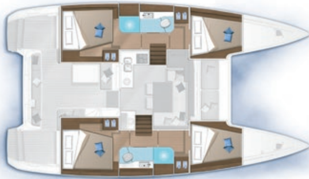
4 cabines, 2 salles d'eau / 4 cabins, 2 bathrooms