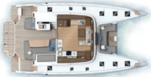
Carré - Versions 6 cabines Saloon - 6 cabin version