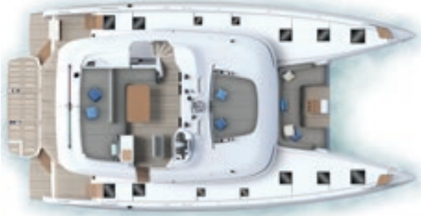
Flybridge & Pont Zone de bains de soleil avant (option) - Accès tribord (option) Flybridge & Deck Optional forward sunbathing area - Optional starboard access