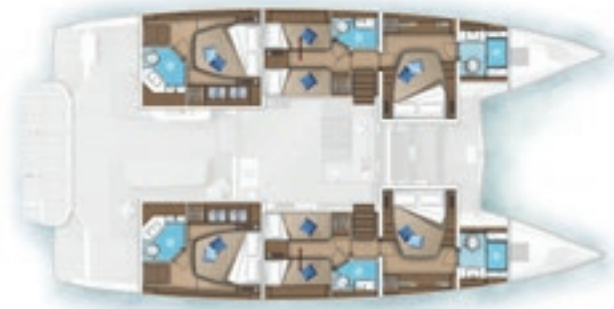
6 cabines - 6 salles d'eau 6 cabins - 6 heads